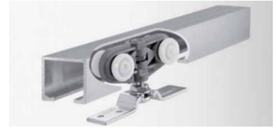
Posuvný mechanismus GEZE Rollan 40 / Rollan 80